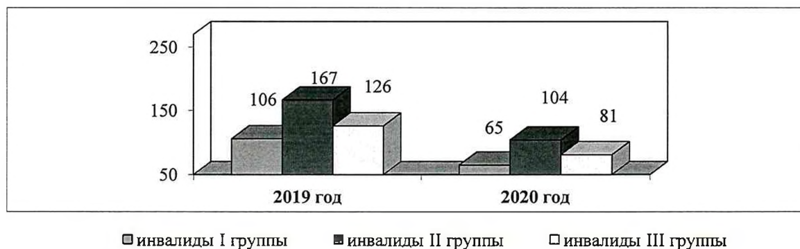
Количество инвалидов, получивших услуги в Учреждении

Из представленных в Диаграмме 7 данных отмечается снижение численности инвалидов, обслуженных Учреждением, на 33,7%, в том числе: 1 группы – на 38,7%; 2 группы – на 37,7%; 3 группы – на 35,7%. Данный показатель связан с демографическими процессами, в именно снижением общей численности инвалидов, проживающих на территории города Югорска, на 11,9%.