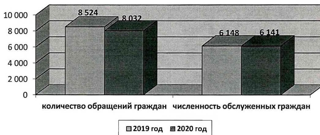
Количество обращений и обслуженных граждан

Услуги Учреждением предоставляются в двух формах социального обслуживания: полустационарная и на дому. В отчетном периоде доля граждан, получивших услуги в полустационарной форме социального обслуживания, составила 98,5% от общей численности обслуженных граждан (Таблица 15).