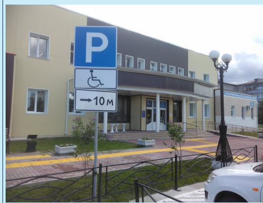
ул. Толстого, д.8