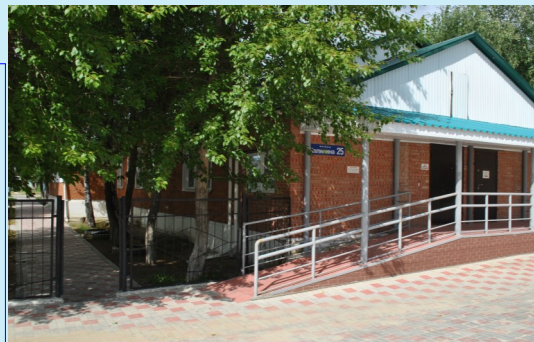
ул. Калинина, д.25