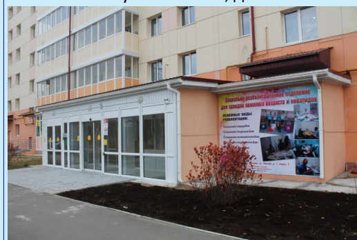
ул. Чкалова, д.7/1