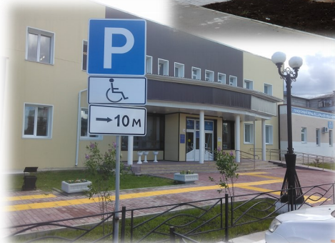
ул. Толстого, д.8