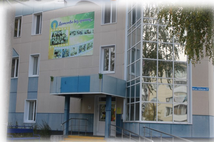
ул. 40 лет Победы, д.3а