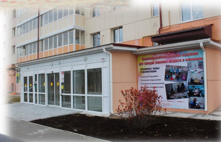
ул. Чкалова, д.7/1