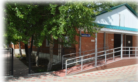
ул. Калинина, д.25